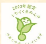
認定マーク 「トライくるみん」