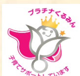
認定マーク 「プラチナくるみん」