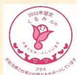
認定マーク 「くるみんプラス」